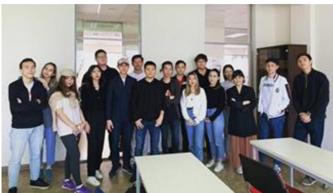
студенты Центра урбанистики

Центр урбанистики основан в 2020 году и реализует уникальную в стране образовательную программу «Урбанистика и сити-менеджмент». Всего в программе обучается 38 студентов. 90% преподавательского состава относятся к НПО, бизнесу и государственному сектору